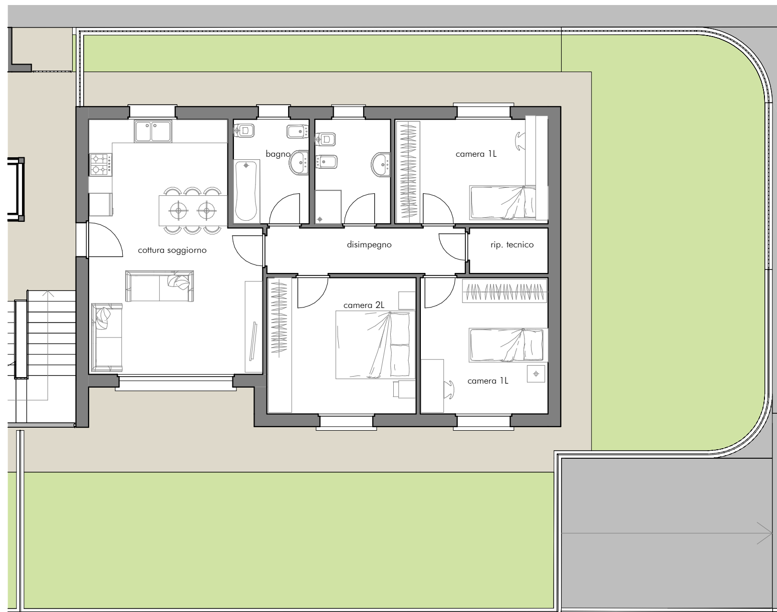
UI2 Pianta piano terra 1:100